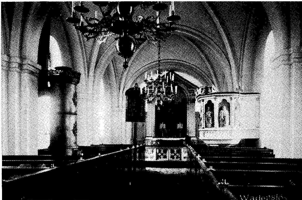
Interiör från Wadensjö gamla kyrka med den stora järnugnen som "Friskan" eldade i.