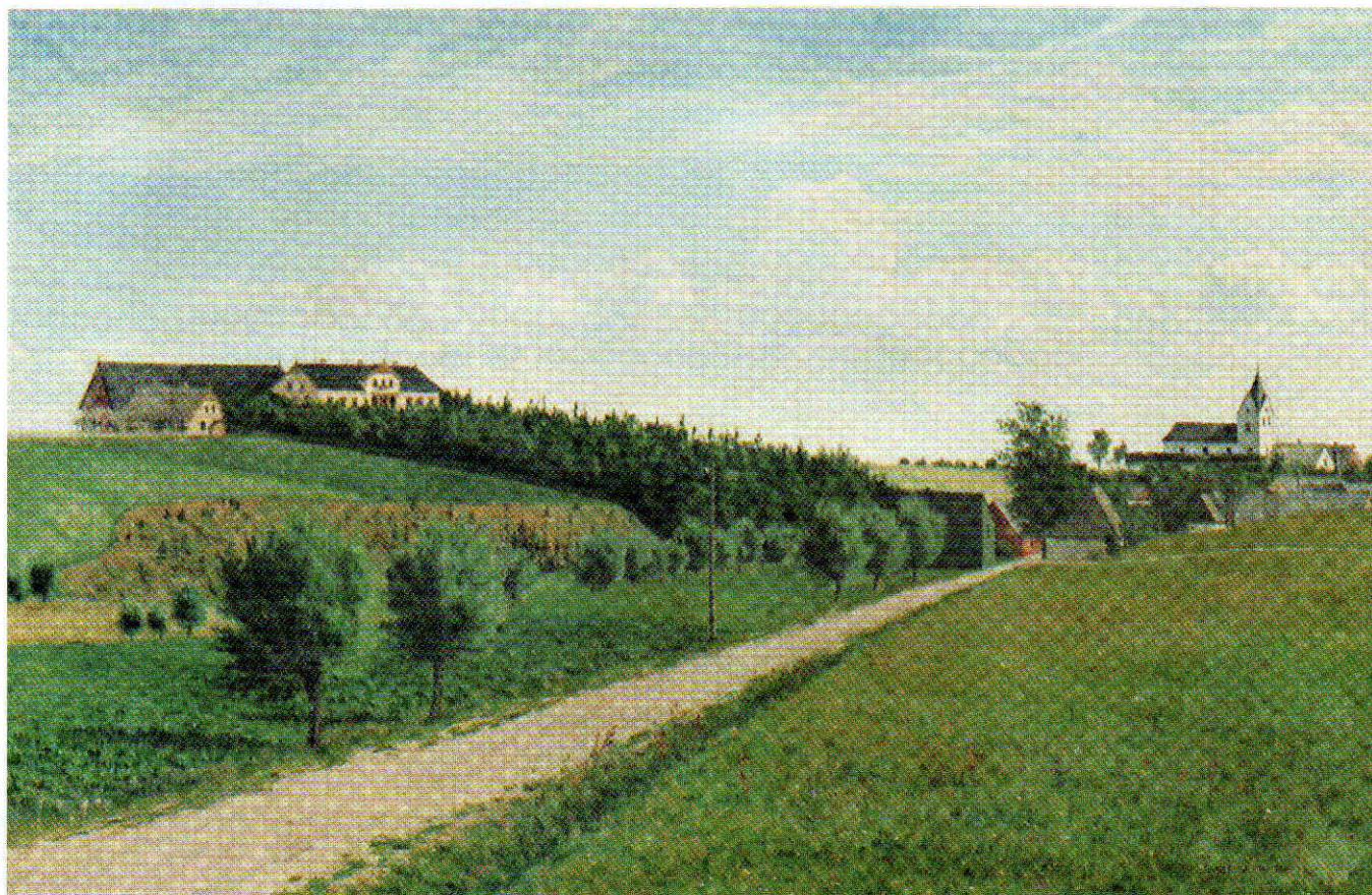
Granliden och Wadensjö vid sekelskiftet. Oljemålning av P. A. Persson.